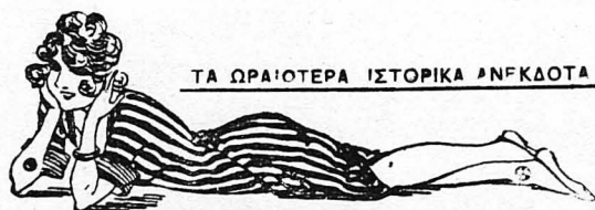
ΤΑ ΩΡΑΙΟΤΕΡΑ ΙΣΤΟΡΙΚΑ ΑΝΕΚΔΟΤΑ

Έφτασεν εκεί μετά αρκετές ήμέρες και ρίχτηκε στη δουλειά, έχοντας πάντα την έλπίδα να συναντήση τη πεθαμένη γυναικά του.