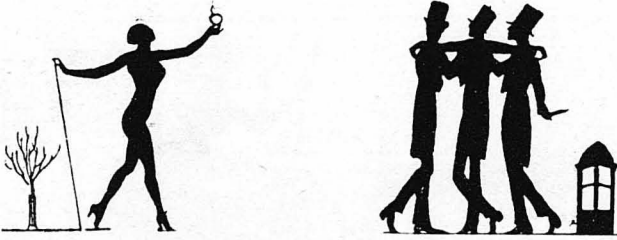
ΓΙΑ ΝΑ ΜΑΓΩΝΑΝΕΤΕ ΚΑΙ ΝΑ ΔΙΑΣΚΕΔΑΖΕΤΕ