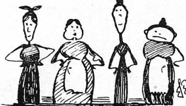
Στήν ταράτσα γυναικοῦτες ἐπερμέναν

Τό φρολόγιον τοῦ Μητροπολιτικοῦ ναοῦ τῆς πόλεως θά ἔκρουε τήν δεκάτην καί ἡμίσειαν . . . ἐάν ὑπῆρχε, ὁπότε τό αἶ' λάιφ τοῦ χωριοῦ ἀπό τήν πόρτα ἐνεφανίσθη.