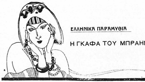
ΕΛΛΗΝΙΚΑ ΠΑΡΑΜΥΘΙΑ Η ΓΚΑΦΑ ΤΟΥ ΜΠΡΑΗΜΗ

Μιά φορά κι 'ένα καιρό κι 'ένα παλιό ζαμάνι, ζούσε ένας Τούρκος — συλλί μαγαριζμένο — Μπραήμη τόν λέγανε — φωτιά στά γένεα του Μουάμεθ — κι 'έκανε τὸ μανάβη. Κάθε πρωί ὁ Μπραήμης φρότωνε — με τὸ συμπάθειο! — στὸ γαϊδάρο του λογιῆς λογιῆς λαχανικά καὶ ζαροζαβατικά κι 'έπερνε παρανταρία τῆς γειτονιῆς νὰ τὰ πούλησι.