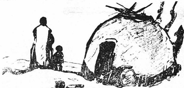
Ἡ καλύβη τοῦ Φακίρη

Ἦρρα θέσι σὲ διαμέρισμα τοῦ ὕπνου. Τὴ στιγμή ποὺ ἔμπαινα στὸ ἐστιατόριο γιὰ νὰ φάγω, εἶδα καθαρὰ στὸ τραπέζι, τὸ ὅποιον εἶχαν φυλάξει γιὰ μένα καὶ στὸ ὅποιον εἶχα ἀφήσει γιὰ σημάδι τὸ ἐπισκεπτήριό μου, εἶδα, τὸν ἀγνωστὸ μου κοκκινομάλη τῶν Παρισίων.