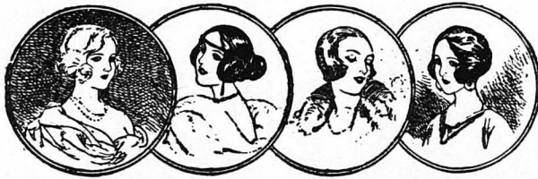
ΣΙΛΟΥΕΤΤΕΣ ΑΠΟ ΤΑ ΣΑΛΟΝΙΑ