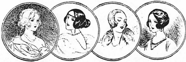
ΣΙΛΟΥΕΤΤΕΣ ΑΠΟ ΤΑ ΣΛΑΒΟΙΑ