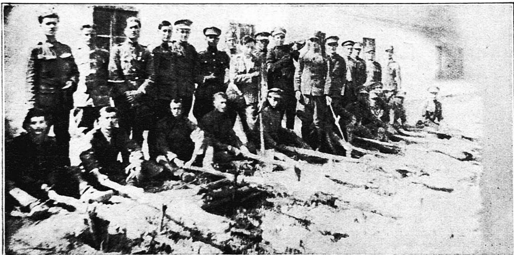
Τὸ ψήσιμο τῶν ἀρνιῶν εις τὴν 3ην Ἴλιν τοῦ 2ου Ἰππικοῦ Συνταγματος.