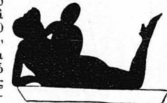
Ο ΜΑΓΟΣ ΤΟΥ «ΜΠΟΥΚΕΤ-ΟΥ»

Ἴδου καὶ σχετικὸν παραδειγμα: Ὑποτίθεται ὅτι ἡ κυρία τῆς παρᾶς γεννήθηκε τὸν Ἰούνιον. Γράφει λοιπὸν τὸν ἀριθμὸν τοῦ μηνὸς αὐτοῦ, δηλαδὴ τὸ 6. Τὸ 6 αὐτὸ τὸ πολλαπλασιάζει ἐπὶ 2. Δύο ἐπὶ 6 ἴσον 12. Εἰς τὸ ἀθροῖσμα αὐτὸ προσθέτει τὸ 5. Δηλαδὴ 12 καὶ 5 ἴσον 17. Τὸ ἀθροῖσμα αὐτὸ τὸ πολλαπλασιάζει μὲ τὸ 50. Δηλαδὴ 17 ἐπὶ 50 ἴσον 850. Εἰς τὸ 850 θὰ προσθέσῃ τὴν ἡλικίαν τῆς. Ἄν δηλαδὴ ὑποθέσουμε πῶς εἶναι 30 ἐτῶν, θὰ προσθέσῃ τὸ 30. Δηλαδὴ 850 καὶ 30 ἴσον 880. Ἀποτόᾳθροῖσμα αὐτὸ θ' ἀφαιρέσῃ 365. Δηλαδὴ 880 ἀπὸ 880 ἴσον 515. Εἰς τὸ 515 αὐτὸ θὰ προσθέσῃ 115. Δηλαδὴ 515 καὶ 115 ἴσον 630. Τὸ ἀθροῖσμα αὐτὸ, τὸ 630 δηλαδὴ, θὰ σᾶς δεῖξῃ ἡ κυρία. Ἐξ αὐτοῦ δὲ θὰ τῆς εἴπῃτε ὅτι οἱ δύο τελευταῖοι ἀριθμοὶ, τὸ 30, εἶναι ἡ ἡλικία τῆς καὶ ὁ πρῶτος, τὸ 6, τοῦ μηνὸς τῆς γεννήσεώς τῆς. Δὲν εἶναι λοιπὸν χαριτωμένο παιγνίδι;