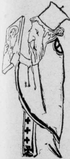
Οι παπάδες φορώντας τα ιερά τους άμφια, κρατούσαν ψηλά τις αγιες εικόνες.