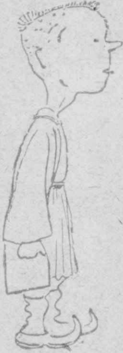
Ο Μιλτιάδης ήταν Άθηναίος στρατηγός.