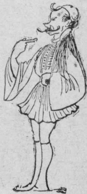
— Κι περι ήμου τί γρουνίζετε, πικρικαλώ;...