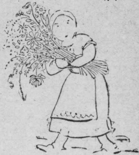
Και ή νιναϊκες φορτωμένες με λουλούδια...