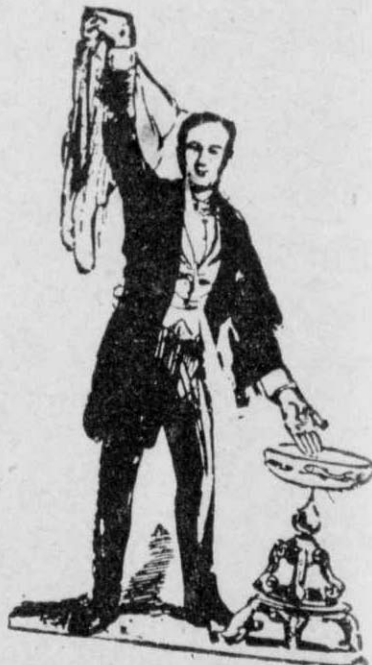
Ο περίφημος Γάλλος ταχυδακτυλουργός Ούντεν.

Και το γαλλικό περιοδικό ρωτάει στο τέλος αν θα λυθώ ποτέ το μυστήριο του Έρεχθείου.