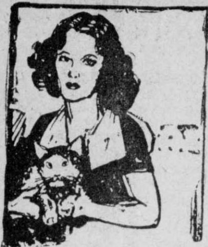
Κουκι, ο «γάτος που ξαναγύρισε από μακριά»

κάγο όπου έμενε ως τότε και να πάη στο Ουίλμπερ της πολιτείας Νεβράσκα, σε αρκετών χιλιάδων χιλιομέτρων απόσταση. Στο ταξίδι της αυτό, που έγινε σιδηροδρομικώς, η οικογένεια πήρε και τον γάτο της, τον Κουκι, όπως τον έλεγαν. Μά ο Κουκι, μόλις η οικογένεια του δικαστικού έγκαταστάθηκε στην καινούργια της διαμονή, γίνηκε αφαντος. Φαντάζεστε δε εύκολα ποιά ήταν η έκπληξις των παλαιών κυρίων του όταν, μιά μέρα, μετά έξη μήνες, έλαβαν ένα τηλεγράφημα από το Σικάγο, από τον παλιό σπιτονοικοκύρη τους, που τους πληροφορούσε ότι ο Κουκι είχε ξαναγυρίσει στο παλιό τους σπίτι!... Είχε κάνει, δηλαδή, ο άθεόφοβος με τα πόδια ένα ταξίδι έξη μηνών, μόνο και μόνο για να ξαναγυρίση στην αγαπημένη του παλιά κατοικία... Πώς δεν έχασε το δρόμο σε μιά τόσο τεραστία απόσταση, αυτό είνε μυστήριο!