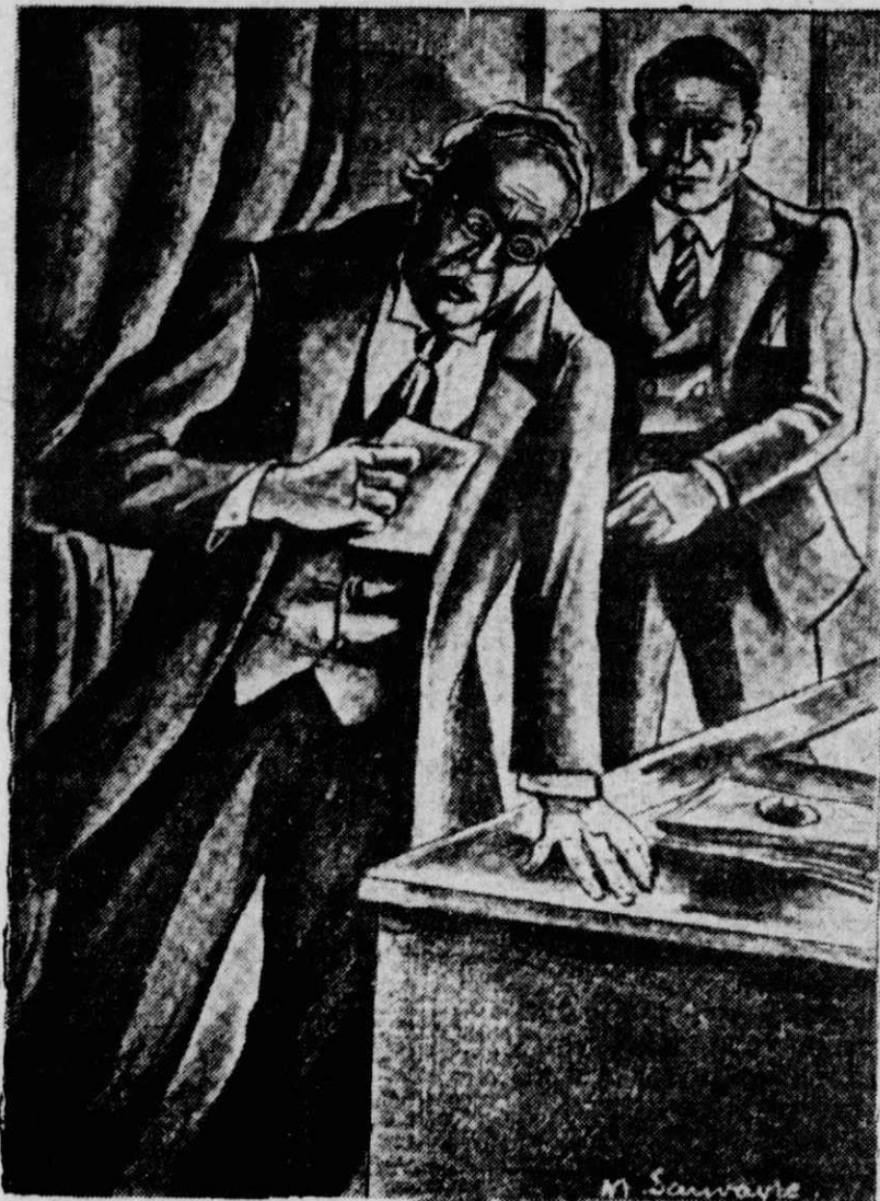
Ο γιατρός κρατήθηκε στο γραφείο του για να μη πέση κάτω...

Ἐπακολούθησε μιὰ στιγμή τραγικῆς σιωπῆς... Καμμιὰ ἀπὸ τίς δυὸ γυναῖκες δεν μπορούσε να ἔξηγήσῃ