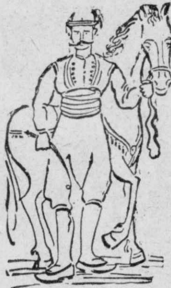
Ήταν ένας ζωέμπορος ψηλός, μελαχροινός, με μάτια ζωηρά