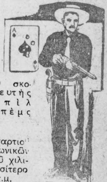
Ο σκοπευτῆς Μπίλ Μπέμς