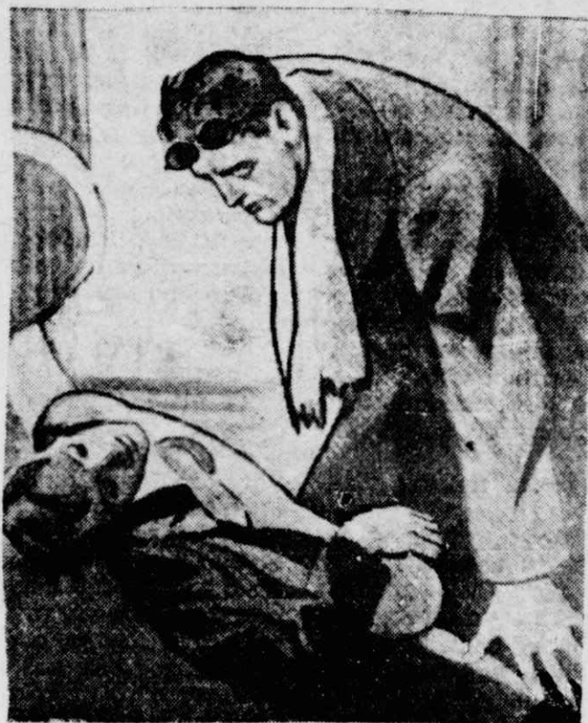
Ὁ Μείβορ σωριάστηκε στὸ πᾶνωμα χτυπημένος κατὰκαρδᾶ...