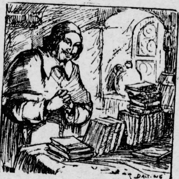
Ὁ Μαζαρίνος ἐμπρὸς τοὺς κατασχεμένους λιθέλλους.

Ὁ Ζάκ Ντυπὸν, σ' ἕνα βιβλίον του ἀναφέρει ὅτι εἶχε μιὰ γάτα ἢ ὁποῖα ὅταν πεινοῦσε κ' ἤθελε νὰ φάῃ, μετεχειρίζετο τὸ ἐξῆς «κόλπο»: Ἐρχόταν στὸ γραφεῖόν του, πηδούσε ἀπάνω στὸ τραπέζι καὶ στεκόταν σοῦζα. Ὅταν δὲ τύχαινε ὁ Ντυπὸν νὰ μὴ τὴν προσέξῃ, τὸν σκουνοῦσε μὲ τὸ πόδι τῆς ἐπίμονα καὶ δὲν ἠσύχαζε παρά μόνον ὅταν αὐτὸς σηκωνόταν γιὰ νὰ τῆς βάλῃ νὰ φάῃ. Σ' ἕνα ἵπποδρόμιον, πάλι, ἕνας γάτος τοῦ Σιάμ εἶχε μάθει νὰ γυρίσῃ μετὰ τὴν ὀψὴν τῆς σφῆρας τῆς ἀνατολῆς καὶ νὰ κιντάρῃ τὴν σελήνην τοῦ ἔτσι, ὥστε νόμιζε κανεὶς ὅτι πραγματικὰ διάβαζε. Οἱ Γερμανοὶ φοιτηταὶ ἐπίσης, ἕνα καιρὸ εἶχαν κυριευθῆ ἀπὸ τὴν μανίαν νὰ κάνουν τίς γάτες νὰ μιλάνε. Καὶ πράγματι, εἶχαν καταφέρει ἕναν γάτον τῆς σχολῆς μ' ἕνα σφοδρὸν τράθηγμα τῶν αὐτιῶν του νὰ τὸν κάνουν νὰ προφέρῃ καθαρὰ τὴ λέξι «μαμά»! πρᾶγμα ποὺ διασκέδαζε ἐξαιρετικὰ τίς φίλες των. Καθὼς βλέπετε, λοιπὸν, ἡ γάτες εἶνε ἐξαιρετικὰ ἐξυπνα ζῶα καὶ ἔχουν ἄλλα τὰ χαρίσματα καὶ τίς ἀδυναμίας μιᾶς πολυχαιδέμενης γυναίκας.