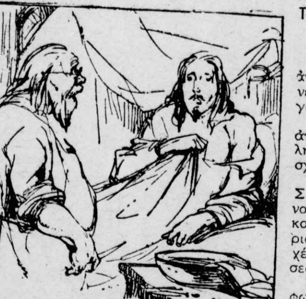
Ὁ Τυρέν καὶ ὁ γιατρός του.

Κατὰ τὴ διάρκεια τῆς ἐκστρατείας του στὴν Ἄλσατία, ὁ περίφημος Γάλλος στρατάρχης Τυρέν κρουολόγησε. Ἀναγκάστηκε λοιπὸν νὰ σταθῇ σ' ἕνα χωριὸν καὶ νὰ φωνάξῃ ἕνα γιατρὸν, ὁ ὁποῖος τὸν περιποιήθηκε, τοῦ ἔκοψε βεντούζες καὶ τοῦ ἔδωσε διάφορα φάρμακα. Μὰ ἦταν τόσο ἀξιοθρήνητο τὸ παρουσιαστικὸν τοῦ γιατροῦ αὐτοῦ ὥστε ὁ Τυρέν δὲν κρατήθηκε καὶ τὸν ρώτησε γιατί εἶχε τέτοια χάλια. — Ἄ, στρατάρχα μου! τοῦ ἀπάντησε ὁ γιατρός. Οἱ χωριάτες ἐδῶ πεθαίνουν χωρὶς νὰ φωνάξουν γιατρὸν. Ζῶ μὲ ψωμοτύρι... — Κατάλαβα! τοῦ ἀπάντησε ὁ ἐνδοξος στρατηγός. Ἐγὼ εἶμαι ὁ Τυρέν καὶ σὺ ὁ ψωμο-Τυρέν!