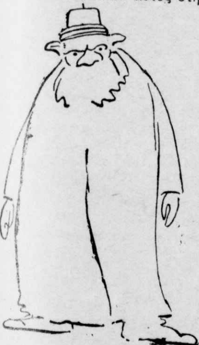
Τούς ἐπάντρεψεν ὁ χόντζας.

— Καλά, εἶπεν αὐτὸς στὴ μάνα τῆς κοπέλλας, σ' ἀφήνουν καί τὸ βλέπεις τὸ κορίτσι σου ἑσένα;