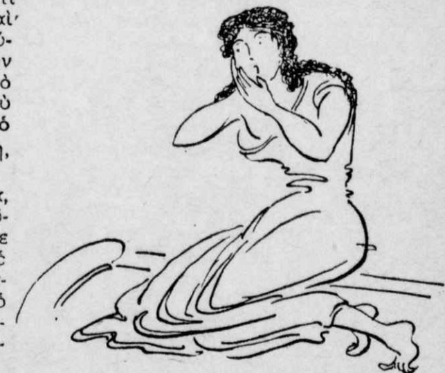
Ἐκείνη τότε ἔκανε τάχα ὅτι φοβήθηκε πολὺ...