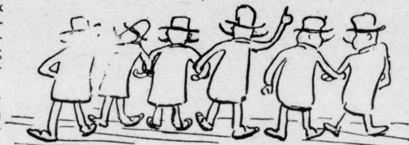
«Όταν πήγε ή έπιτροπή στη Βουλή.