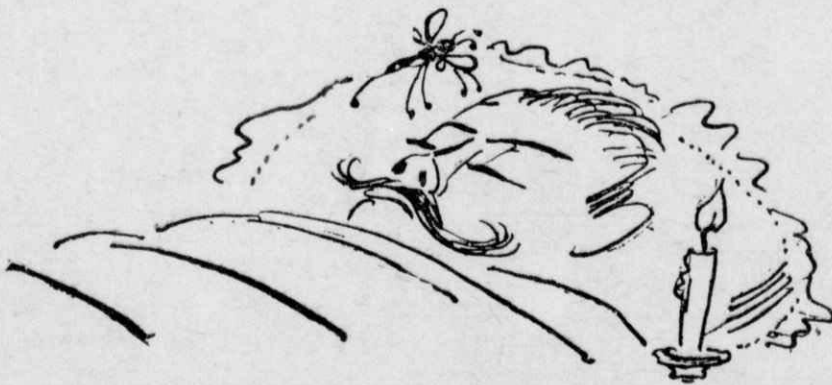
Μόνον ό Σύνδεσμος έφησούχαζε