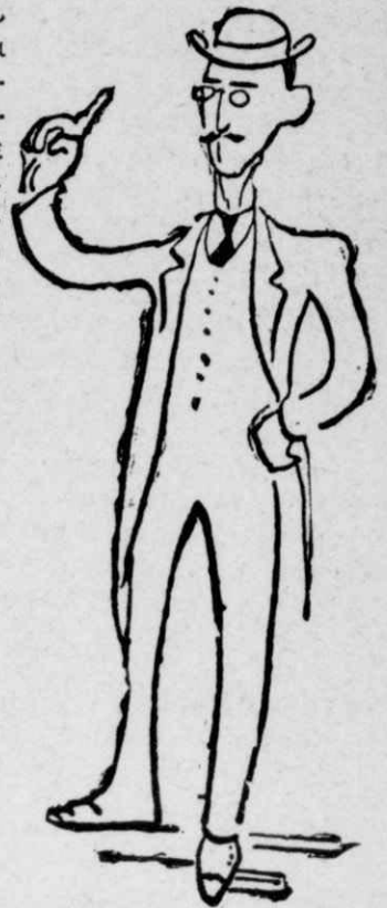
Γίσει ἄρτι ἐπανελθόντες ἀπὸ τὰς Εὐρώπης.

Ἐννοεῖται δὲ ὅτι σὲ κάθε ἐφημερίδα ἔτρεξαν πολλοὶ καὶ διάφοροι ἄλλοι «νυμφιοὶ» καὶ κάθε ἕνας ἔβαλλε κατὰ τοῦ καθηγητοῦ