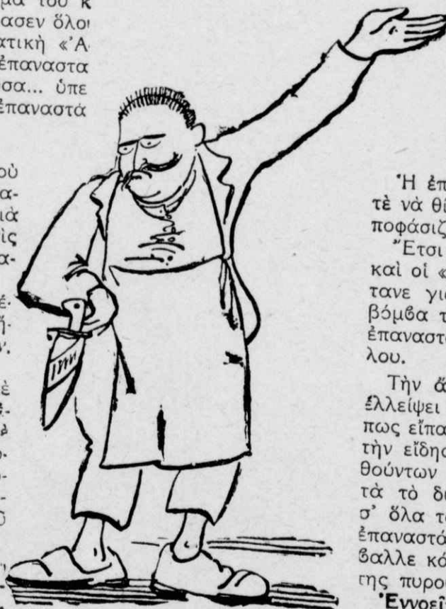
Ἐξύπνησε καὶ ὁ λαός.

Ὁ Ζερβόπουλος πάλιν, γιὰ νὰ τοῦ ἀποδείξῃ ὅτι δὲν ἔφταιγε αὐτὸς ἀλλὰ τὸ... κίνημα, ἀποφάσισε νὰ ὑποκαταστήσῃ τὸ Διοικητικὸ Συμβούλιον τοῦ Στρατιωτικοῦ Συν-