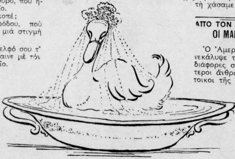
— Ἄν τὸ φαντασθῶν...