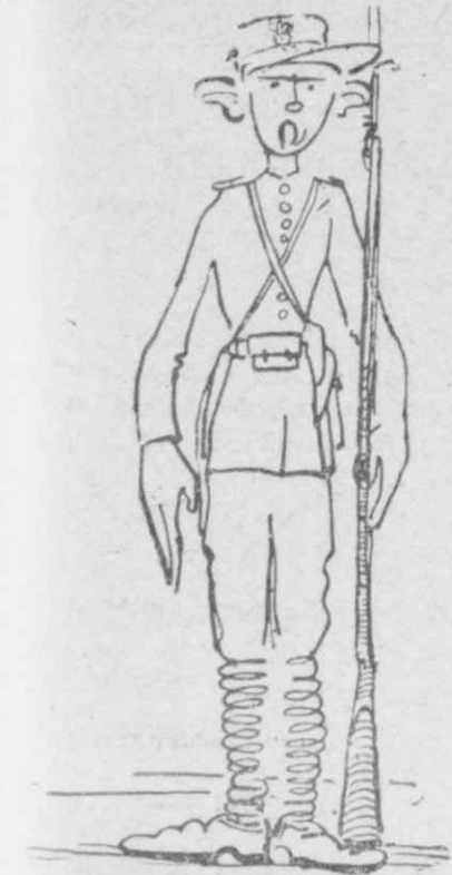
Μιά ημέρα που στεκότανε εκεί κοντά σκοπός.

Και ούδέποτε βεβαίως ο Μήτρος ο Τσικνιάς θά κατέρριπτε ποτέ το γόητρον του ελληνικού στρατού ή και το δικό του, έπαιτών ή άπαιτών άρτον και παραμεζέν από