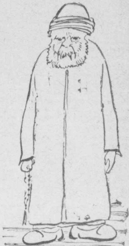
Τους όθωμανούς κατοίκους Καστοριάς.

Και νά τες πάλι νά περνούν σαν άμαρτίες από μπροστά του, στρατός όλόκληρος, ή πάπιες, καμαρωτές - καμαρωτές και σοβαρές, κι' άργογλυστρώντας ήδονή άπάνω στα ήσυχα νερά.