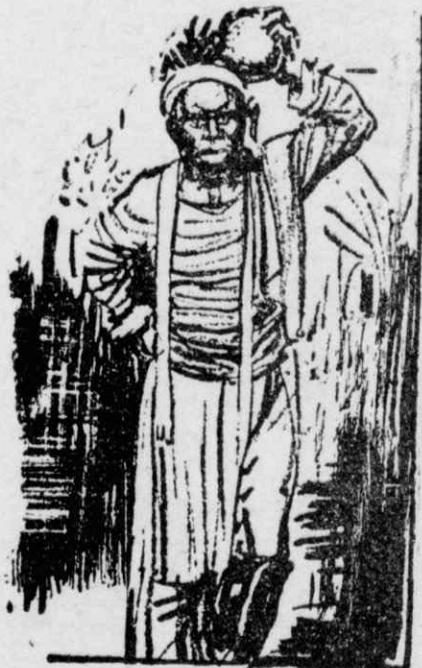
Οἱ Ἰθαγενεῖς τῆς Κούβας ποὺ σπάζουσι τὰ ἰνδικὰ καρύδια στὰ κεφάλια τους!...

Σὲ μερικὰ μέρη ὁ καπνὸς κόβει τὴ μισὴ ἀπὸ τὴ δύναμι τοῦ ἡλίου.