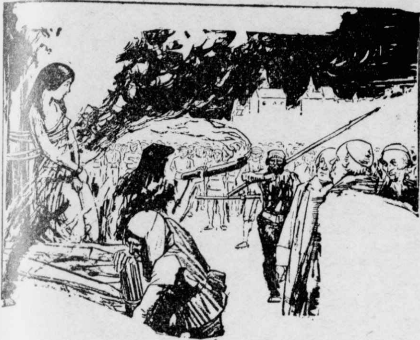
Ἡ ἐκτέλεσις τῆς Ζακελίνας Μόμμαντ

Ἡ κομμώτριες τῆς ἐποχῆς μας, ὄχι μόνο ἐξασκοῦν ἐλεύθερα τὸ ἐπάγγελμά τους, ἀλλὰ καὶ κερδίζουν ἀπ' αὐτὸ ἀφθόνα χρήματα. Καὶ ὅμως σὲ μιὰ ἄλλη ἐποχῇ, κάποια γυναίκα ποὺ θέλησε νὰ κάνῃ τὴν κομμώτρια, κἀκε ζωντανή, ὅπως οἱ μάρτυρες τοῦ Χριστιανισμοῦ.