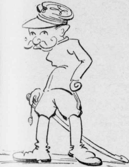
— Πῶς τοῦ λέν, οὐρὲ Γαρούφαλλε, τοῦ ἀγαπῶ;

— Πῶς τοῦ λέν, οὐρὲ Γαρούφαλλε, τοῦ «ἀγαπῶ» σ' αὐτὴν τὴν παληόγλωσσα τῆ βουλγάρικη; ρωτοῦσε.