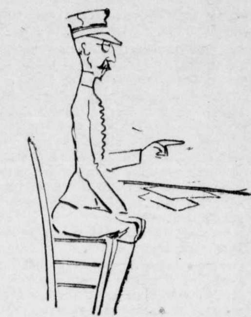
Διαταγὴ ἀπὸ τὸν μέραρχο!