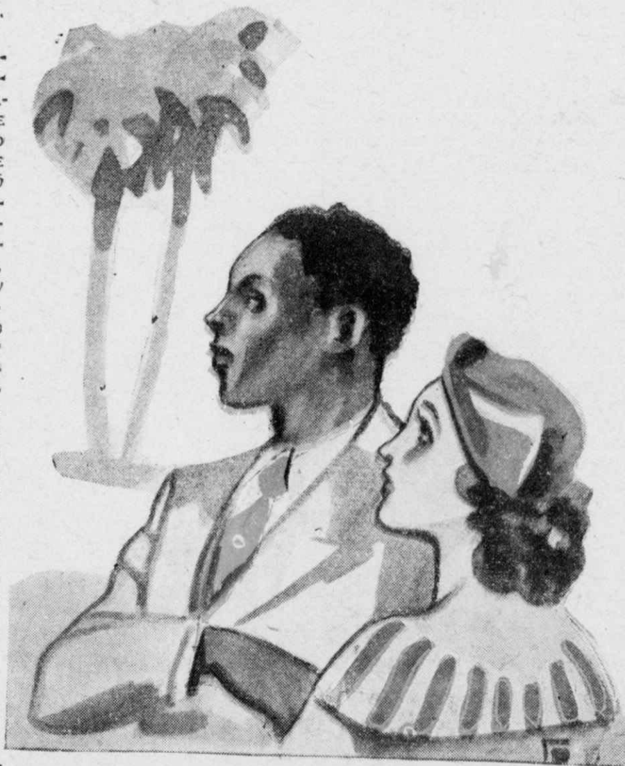
Ἡ Λευκὴ βιάδιζε μπροστὰ μὲ τὸν μιγάδα