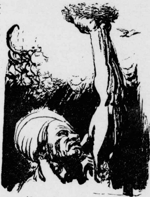
Ο φακίρης 'Αγκαστίγια...

Απ' την ήμερα εκείνη, ο Μπέλχερ έγινε διάσημος στους παγκοσμίους άθλητικούς κύκλους, για την έπαγγελματική εύσυνειδησία του.