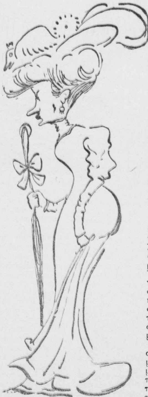
Η κ. Ρουφουλίνα είχε σχέσεις όλο και με άριστοκρατία.