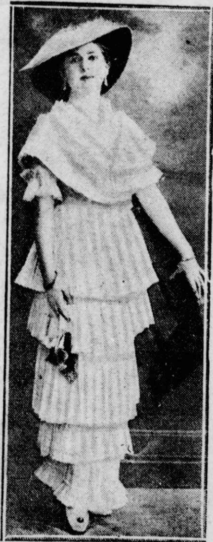
Ἡ τραγικὴ χορεύτρια Μάτα Χάρι.

Τὴν ἄλλη ἡμέρα ἀντίκρουσε κ' ἡ Μάτα-Χάρι τὸ ἐκτελεστικὸ ἀπόσπασμα. Φοροῦσε μιά πολυτελῆ τουαλέττα χοροῦ, ἀρνήθηκε νὰ τῆς δέσουν τὰ μάτια καὶ κύτταζε τοὺς στρατιῶτες τοῦ ἐκτελεστικοῦ ἀποσπάσματος χαμογελῶντας καὶ σιγανοτραγουδῶντας μιά εὐθυμῆ