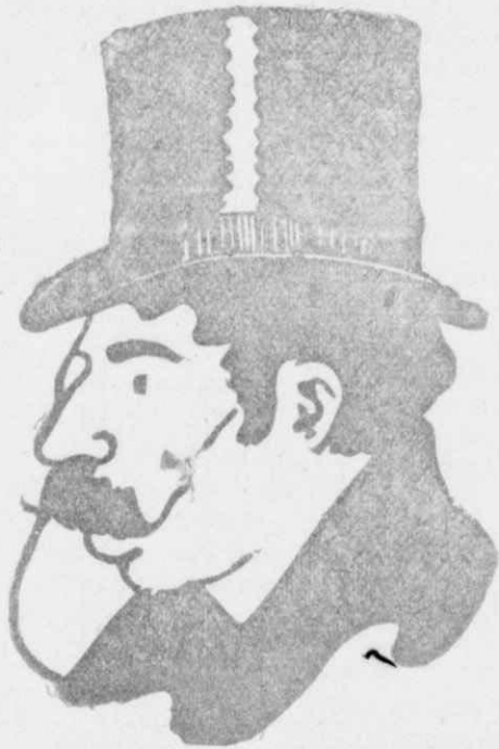
Ό Ζαν Μορεάς (Σκίτσο του Βαλλοτόν)