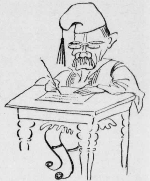
Τοῦ ἔγραψεν ἀπὸ τὴν Ἄμφισσα

Καὶ ἐπειδὴ φοβόταν μὴν πεθάνῃ καὶ χάσῃ ἡ