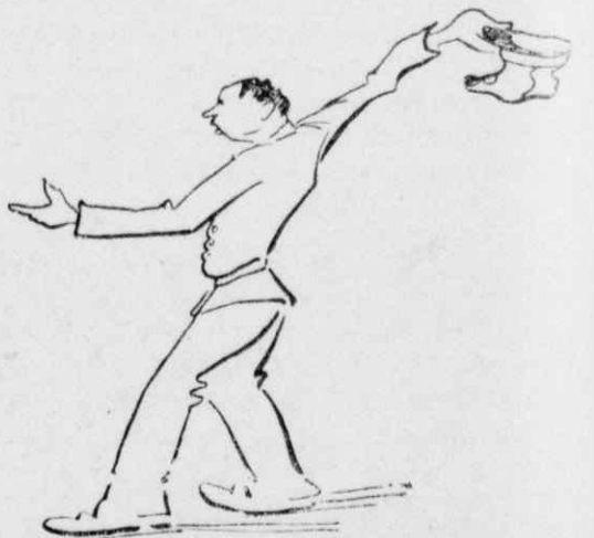
— Ζήτω ἡ Ἄλθιων! Κυβέρνα Βρεττανία!...