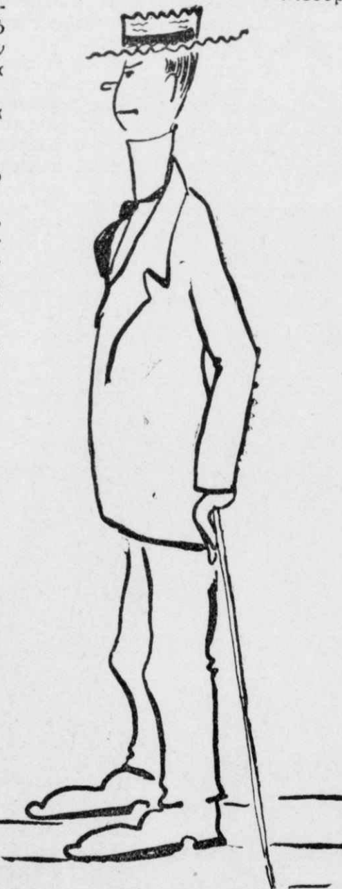
Ὁ Γούλης φοροῦσε ψηλὰ κολάρα κ' εἶχε καὶ μπαστουνάκι.