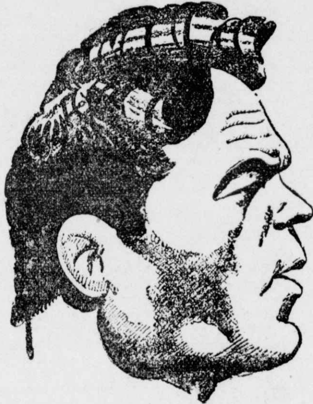
Ένα επιτυχεστάτο σκίτσο του Τζιμ Λόντου

Τότε είδα και την πρώτη πάλη στη ζωή μου. Έπρόκειτο να δοθῆ μια συνάντησις μεταξύ του Έλληνος παλαιστού Δημητρέλη και του Ζεμπίσκου. Όλοι μιλούσαν γύρω μου γι' αυτή την πάλη κι' έτσι κινήθηκε και μένα το ενδιαφέρον μου να πάω να την ιδώ. Το φθηνότερο όμως εισιτήριο έκόστιζε 50 σέντς και που να θρω εγώ ένα ποσόν τόσο κολοσσιαίο! Αναγκάστηκα λοιπόν να τὰ δανεισθώ τὰ χρήματα αυτά και έτσι έπῆγα. Έννοείται όμως ότι η θείσις μου στο άμφιθέατρο θρискόταν τόσο ψηλά, ώστε από κεί που καθόμουν έβλεπα τους ανθρώπους σαν μυίγες. Δεν μ' έννοιαζε