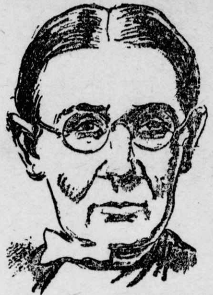
'Η «Δασκάλα - Φαινόμενον»!

Είνε λοιπόν ή δέν είναι άξιοζήλευτοι οι τυχεροί κληρονόμοι του Ραμπελαί;;