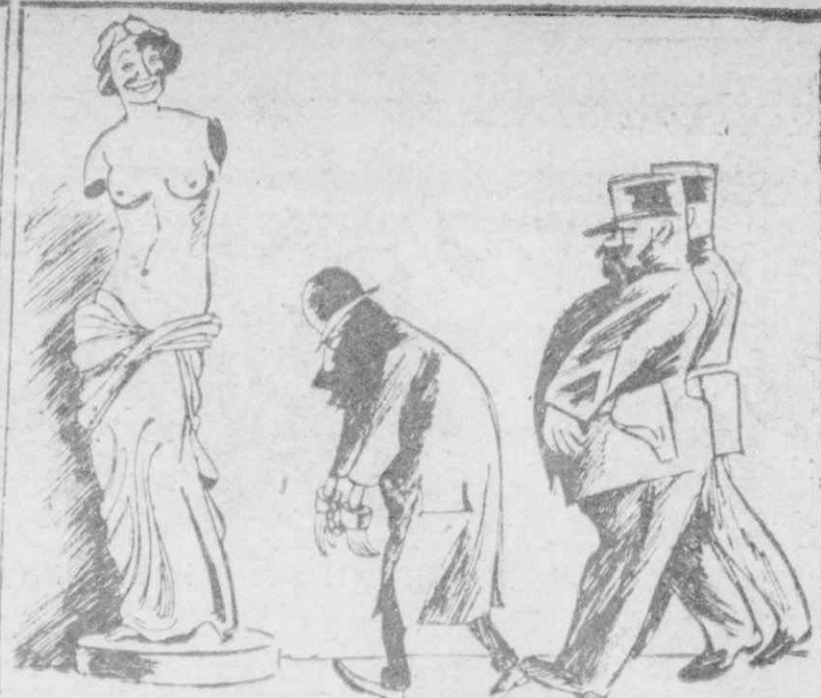
Η ΧΑΙΡΕΚΑΚΙΑ ΤΗΣ ΑΦΡΟΔΙΤΗΣ

"Η τελευταία του πνοή του βγήκε απ' τὰ ρουθούνια καί έστειλε στο διάβολο ντοτόρους καί μαντζούνια!