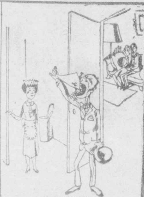
Η ΕΚΔΙΚΗΣΙΣ ΤΟΥ ΠΡΟΔΩΜΕΝΟΥ

"Από τὰ ραδιόφωνα άύπνος καθώς ήτον Πήρε τó φλίτ καί ρίχτηκε κατά των... παρασιτών!