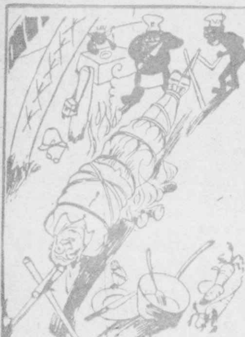
Η ΕΚΔΙΚΗΣΙΣ ΤΟΥ ΠΕΡΙΗΓΗΤΟΥ

"Αν ήσουνα, θρέ φουκαρά, κοιλός ώσάν καί μένα δέν ήθχαν μέ τὰ σίδερα τὰ χέρια σου θεμένα!