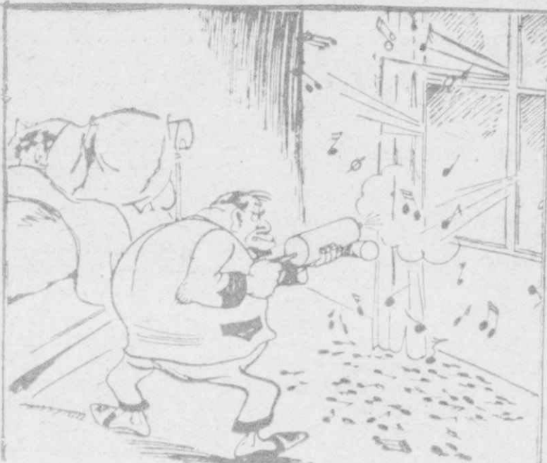
Η ΕΚΔΙΚΗΣΙΣ ΤΟΥ ΝΕΥΡΙΚΟΥ

"Εκεί πού τόν έμήσανε οι μαύροι (κλεί τó μάτι καί λέει: —Σας την έσκασα, σας έκλεμα τ' άλάτι!