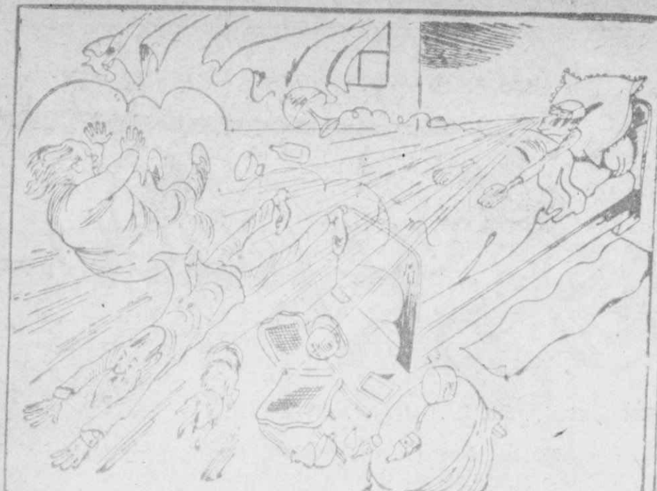
Η ΕΚΔΙΚΗΣΙΣ ΤΟΥ ΕΤΟΙΜΟΘΑΝΑΤΟΥ

"Η τελευταία του πνοή του βγήκε απ' τὰ ρουθούνια καί έστειλε στο διάβολο ντοτόρους καί μαντζούνια!