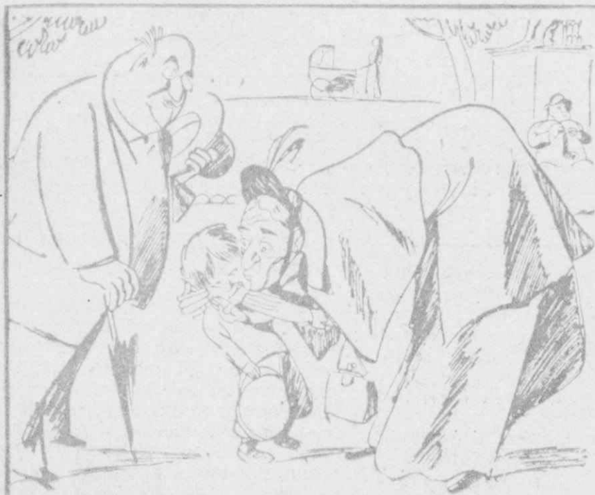
Η ΕΚΔΙΚΗΣΙΣ ΤΟΥ ΜΙΚΡΟΥ

"Όταν εις άλλου άγκαλιά την είδε (έμυγράνήη Κι" όμοῦ μέ τή χολόπηττα έφαγε (καί τὰ άνθη!