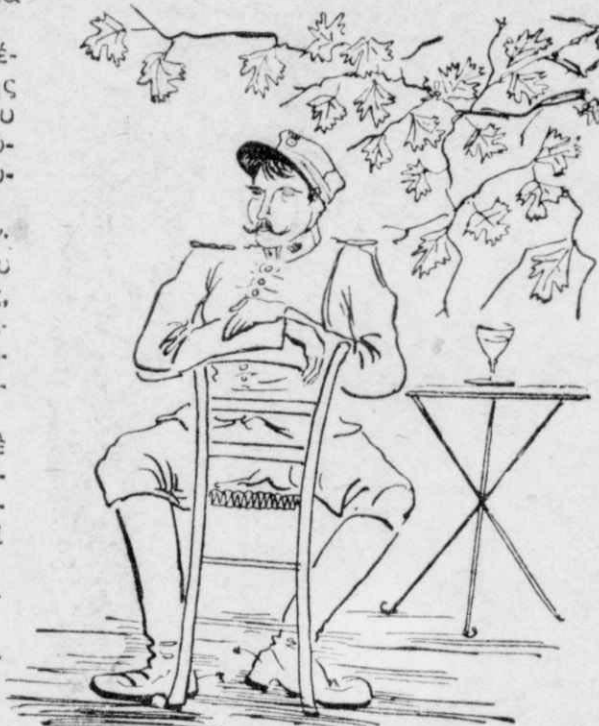
Ὁ κύρ' άστυνόμος