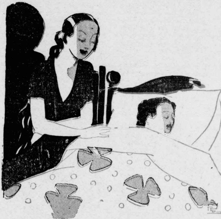
Πήγαινε και καθόταν στο κρεβάτι του μικρού Ι καστόν.