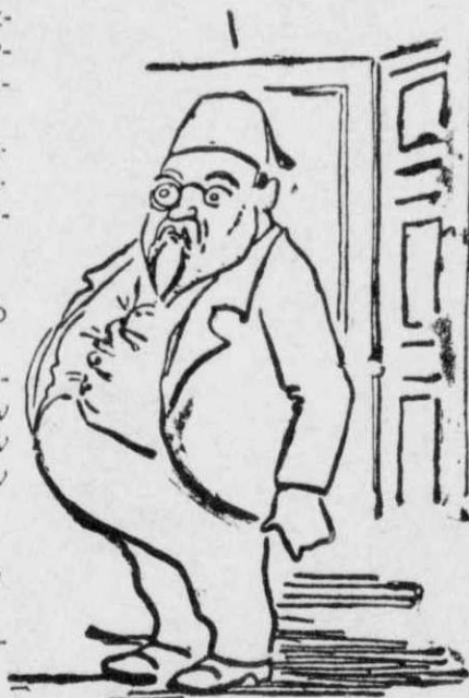
Έκείνη τη στιγμή, άνοιχθηκε μια πόρτα και μπήκε μέσα ένας άνθρωπος κοντός, χοντρός και στρογγυλός.