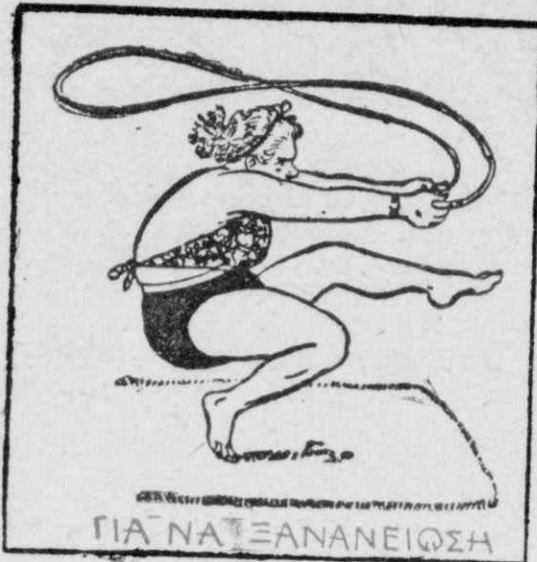
ΓΙΑ ΝΑ ΞΑΝΑΝΕΙΩΣΗ