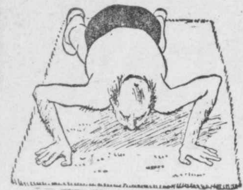
ΓΙΑ ΝΑ ΓΙΝΗ ΓΟΗΣ