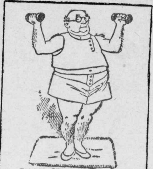
ΓΙΑ ΝΑ ΓΙΝΗ ΕΚΟΜΨΟΣ!