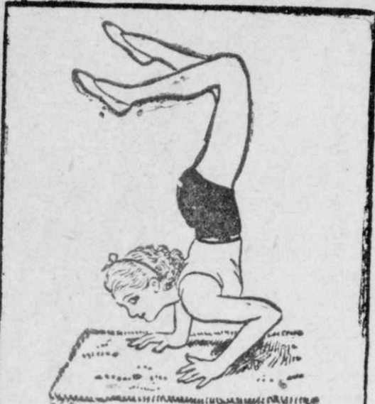
ΓΙΑ ΤΗΝ ΑΡΕΣΗ