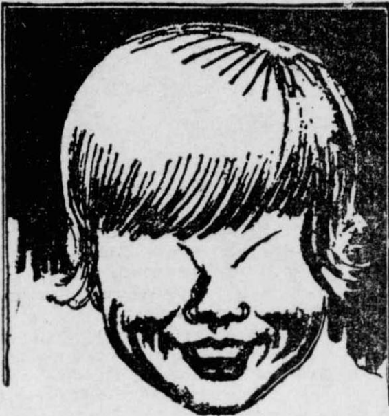
Το κοριτσάκι που γεννήθηκε χωρίς μάτια.

αυτά τόσο δυνατά, ώστε ν' αντέχουν σ' του σώματός μας. Ωστόσο, το ρεκόρ σέ παρομοία έκγύμνασι τῶν ἄνω ἄκρων του, τὸ ἔχει ὁ Ἀμερικανὸς ἀκροβάτης Ρόμπερτ Τζόουνς, ἀπ' τὴν πόλι Πάιν-Μπλάφ τοῦ Ἀρκάνσας.