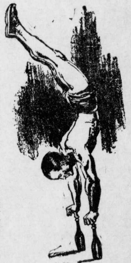
Ὁ ἀκροβάτης Τζόουνς