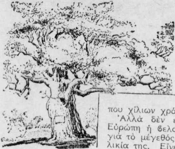
Ἡ θελανιδιά... τάφος!