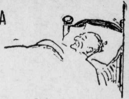
Ὁ... ἰσοθίτης ὑπναρᾶς!