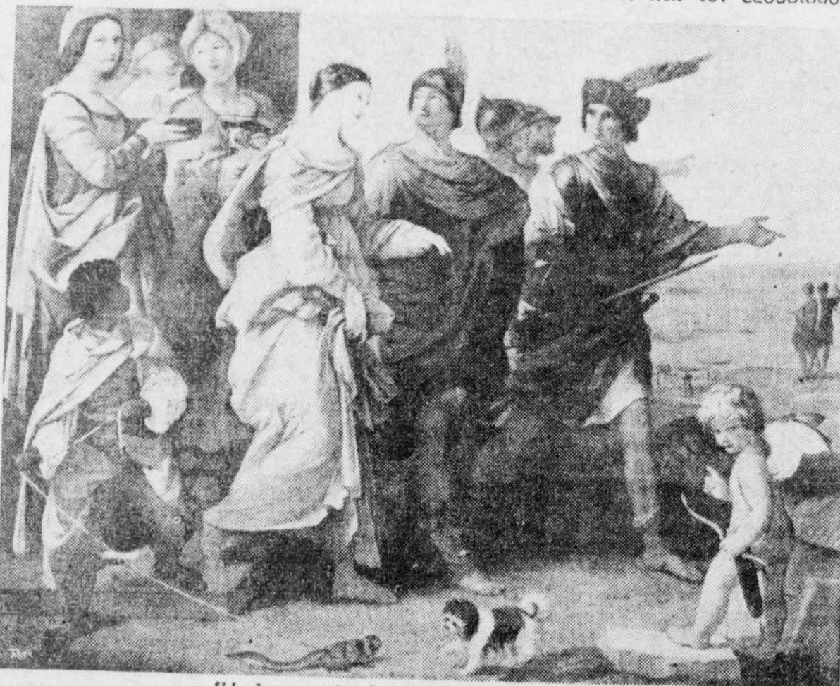
Ἡ ἀπαγωγὴ τῆς ὠραίας Ἑλένης (Ἔργο τοῦ Γκίντ, Μουσεῖο Λούβρου)

Καὶ ἄς ἔρθουμε τῶρα στὸν Μεσαίωνα. Κάποια ἡμέρα, ἐνῶ ὁ διάδοχος τοῦ ἀγγλικοῦ θρόνου καὶ θετὸς υἱὸς τοῦ Ἄγγλου Βασιλέως Ἐδουάρδου τοῦ Ἐξομολογητοῦ, ἔκανε περίπατο μὲ τὸ πλοιάριό του στὴ θάλασσα τῆς Μάγχης. ἀντίθετος ἄερας τὸν πέταξε, ὕστερα ἀπὸ ἀρκετὲς περιπέτειες, στὴν ἀκτὴ τῆς Νορμανδίας, ἡ ὁποία ἦταν τότε