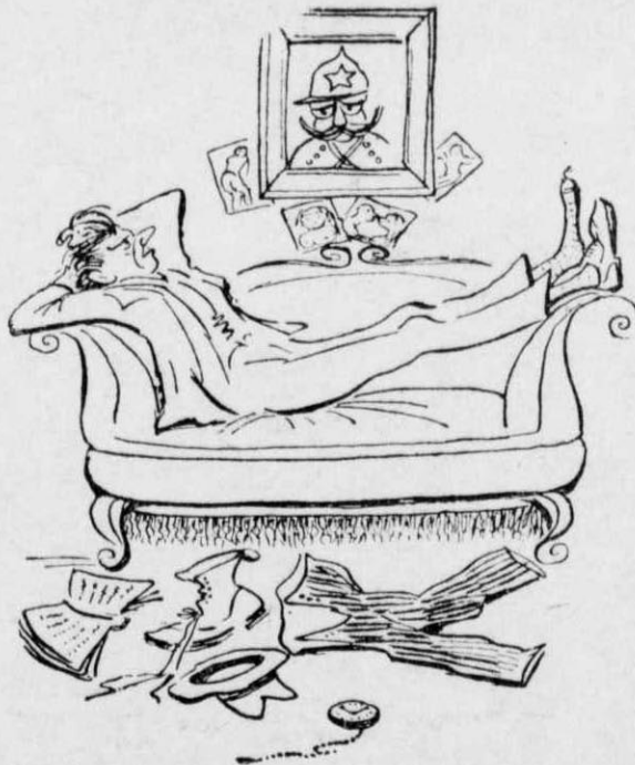
Στον καναπέ του εξαπλωμένος πάντα, μέσα στην άταξία και την άκαταστασία.