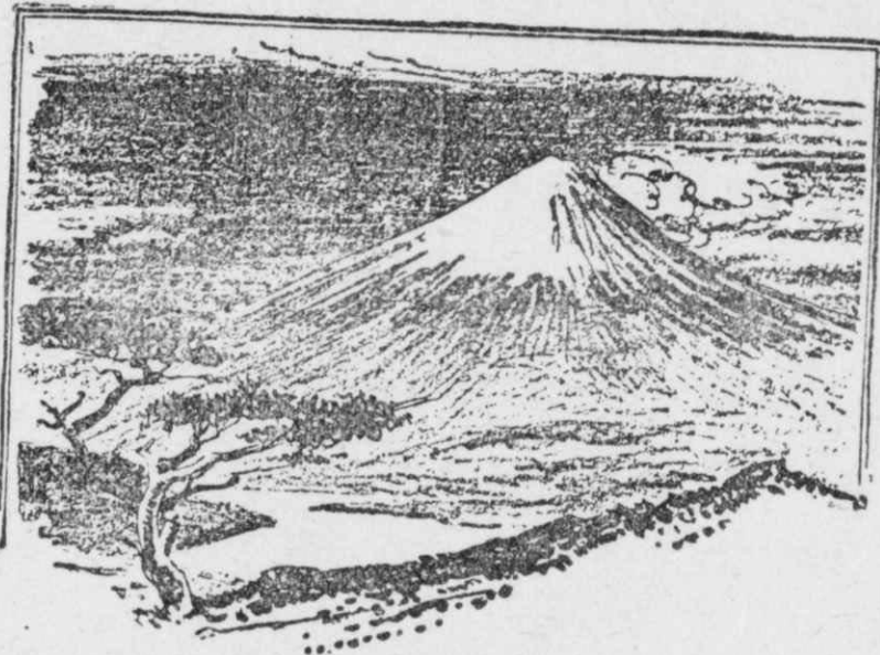
Τὸ ἡφαιστειο Φουτζιγιάμα, μὲ τὸν εὐλύγιστο κρατῆρα του...