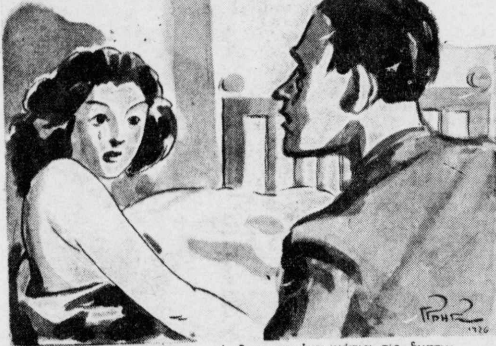
»Εκείνη μου διηγήθηκε με δακρυσιμένα μάτια τις δυστυχίες της.