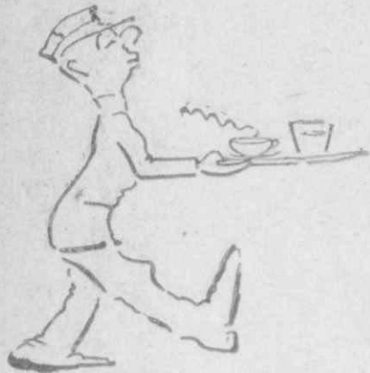
Κι' ὁ Πατσουλῆς καμάρωνε.

— Νὰ σηκωθῆς ἀπὸ αὐτοῦ πού τρώπωσε καὶ νὰ πυροβολήσῃ. Δὲν