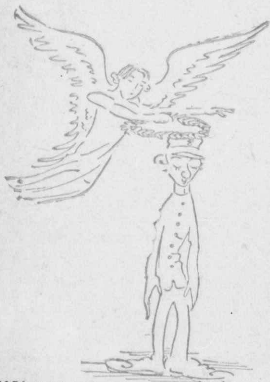
Ἄδονατον, κύρ ταγματάρχα, γιατί θὰ κρυώσῃ ὁ καφές.