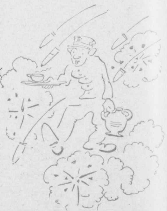
Ἦτανε ἥρωας ἀληθινός!