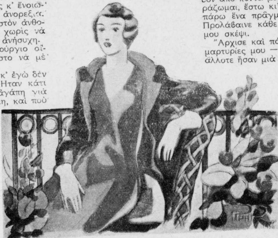
Ὅλο σχεδὸν τὸ πρῶτὸ πέρασα στὸν ἀνθοστόλιστο ἐξώστη τῆς θύλας μας.