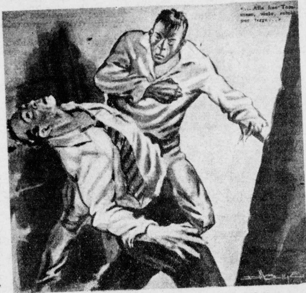
Ὁ 'Αναμίτης, με μιὰ γροθιά, τὸν ξάπλωσε καταγῆς...

— "Ε, νά, ἡ ἀστυνομία ὕστερα ἔξακρίβωσε ὅτι ὁ δολοφόνος εἶχε περάσει τὴ νύχτα τοῦ έγκλήματος σὲ ἕνα δωμάτιο τοῦ ἴδιου ξενοδοχείου. Κι' ὅπως ξέρεις τώρα, Ντελλύς, ἐκείνο τὸ σαράβαλο τῆς ὁδοῦ Λομόν εἶνε γεμάτο σκόνη. Παντοῦ, στὰ ἔπιπλα, στὸ πάτωμα, στὰ κρεβάτια, στὰ στρώματα, ὑπάρχουν διαρκῶς δυὸ δάχτυλα σκόνη. "Ε, λοιπόν, κάτω ἀπὸ τὸ στῶμα τοῦ κρεβάτιοῦ στὸ ὁποῖο εἶχε κοιμηθῆ ὁ δολοφόνος, ἔλειπε ἕνα μεγάλο