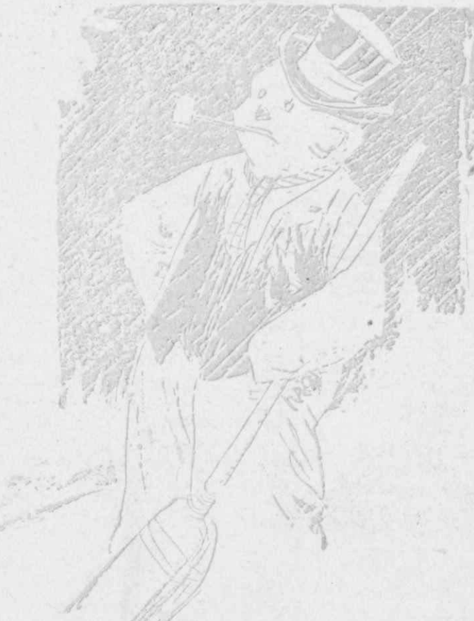
Ένας απ' τους «χιονένιους ανθρώπους» της κυρίας ντε λά Μπρές...

Πραγματικώς, ο μέγας αυτός νομοθέτης των Περσών κ' ιδρυτής της θρησκείας του «Παρσιισμού», έζησε τα τελευταία τριάντα χρόνια της ζωής του τρώγοντας άποκλειστικώς και μόνον φρέσκο τυρί, και πίνοντας μόνον νερό. Ήταν δέ τόσο ή άνθηρότης του κορμιού του και της υγείας του, με την άγνη αυτή διαίτα του, ώστε όλοι πιστευαν, ότι ο βαθύγηρος αυτός θρησκευτικός άρχηγός των είχε νικήσει όριστικώς τον θάνατο!