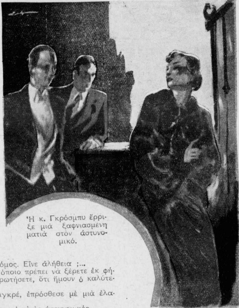
Ἡ κ. Γκρόσμπυ ἔρριξε μιὰ ξαφνιασμένη ματιὰ στὸν ἀστυνομικό.

— Μὴν ἀνησυχεῖτε, κυρία μου, τῆς ἀπάντησε ὁ Μαιγκρέ, Ζη-