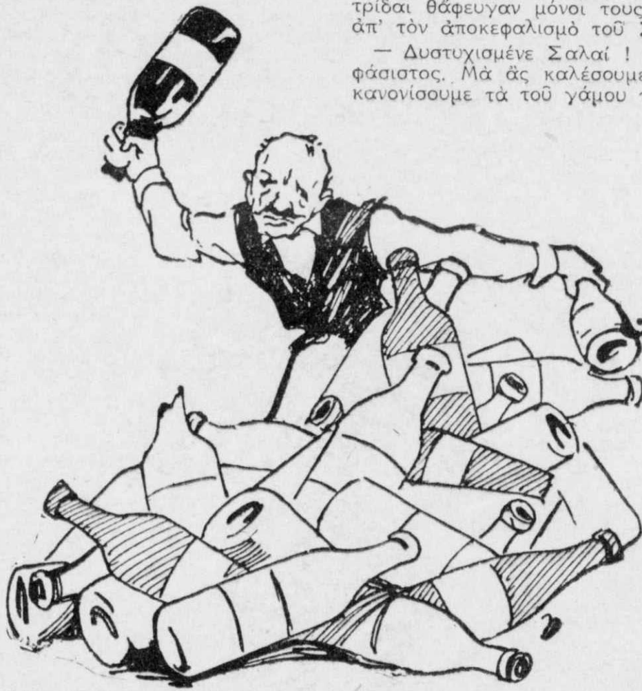
Ἄρπαξε δυὸ μπουκάλια καί δὲν ἄφηνε κανένα νά πλησιάσῃ.

Κατάχλωμος ἀπ' τὴ συγκίνησί του ὁ Γάστων ντ' Ἀνζοῦ, ὑποκλίθηκε μὲ σεβασμὸ καί βγῆκε ἀπ' τὸ βασιλικὸ δωμάτιο. Γοργὸς ὁ καρδινάλιος καί κλείνοντας συνθηματικὰ τὸ μάτι του στὸν βασιλέα, ἀκολούθησε τὸν νεαρὸ πριγκηπα ὡς τὸν προθάλαμο. Καί συγχαίροντάς τον φιλικώτατα κ' ὑποκριτικὰ, τὸν ὠδηγοῦσε συγχρόνως μὲ τρόπο πρὸς τὴν αὐλὴ τῶν ἀνακτόρων, ἔχοντάς τον πιασμένο ἀπ' τὸ μπράτσο. (Ἀκολουθεῖ)