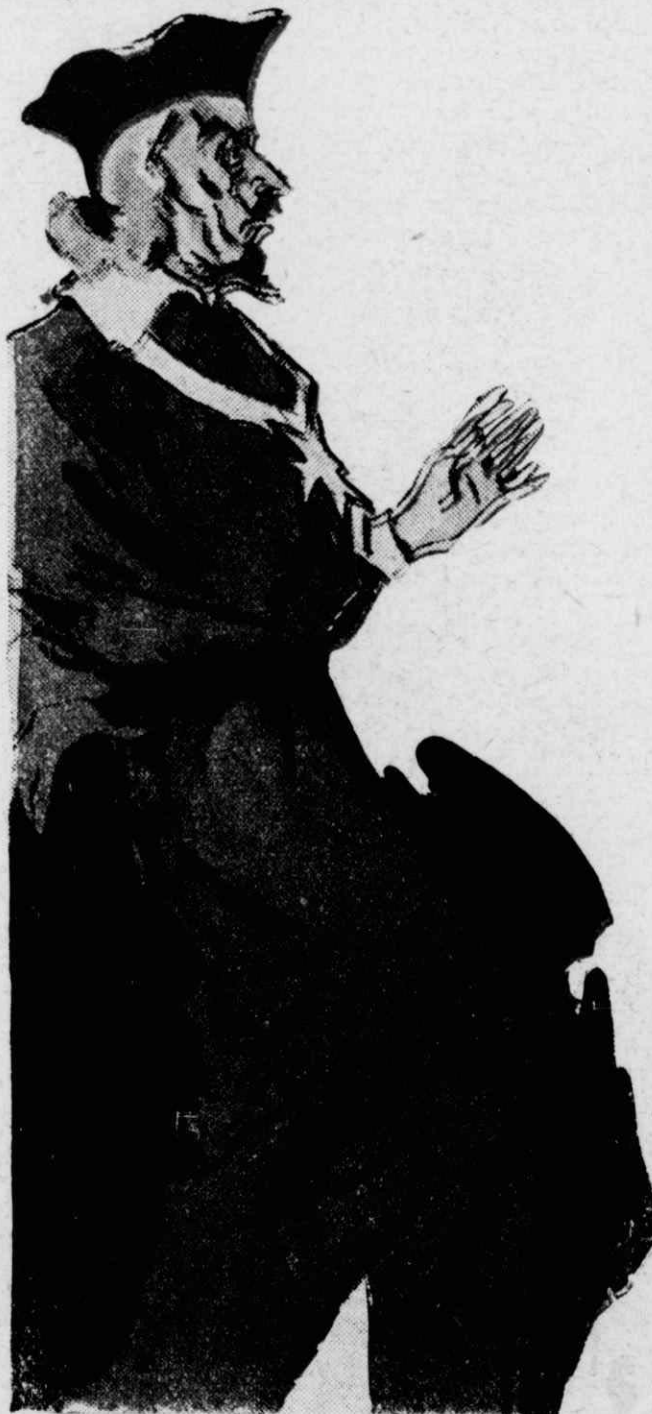
“Ὁ Ρισελιέ τραβήχτηκε πίσω τρουαγμένως.

— Ὁ κόμης Μπλουὶ! εἶπε ὁ Ρισελιέ. Ἀνήκετε λοιπόν στὴν οἰκογένειαν, ἡ ὁποία