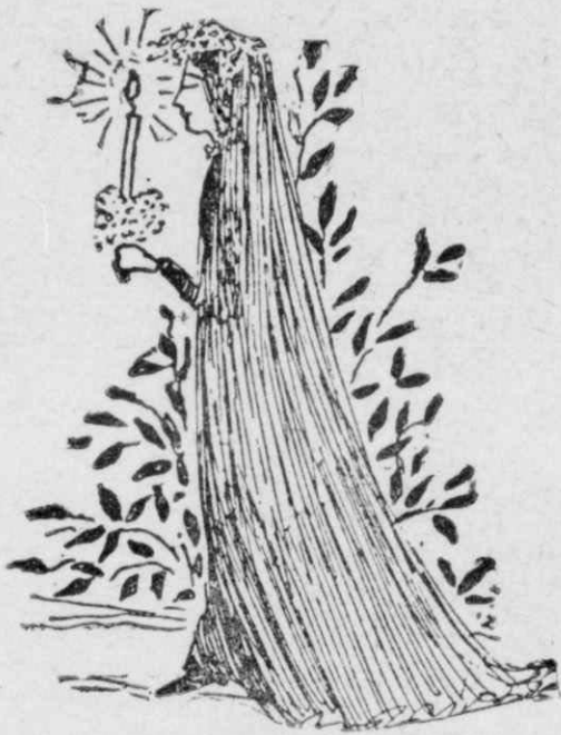
Ἡ Δάφνη, νύφη, μετὰ ἄσπρα τὰ λουλούδια, ἀλλὰ μετὰ μαῦρα πέπλα.