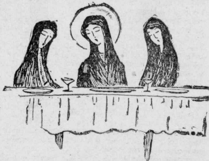
Νὰ στρώσης μαῦρη τράπεζα μετὰ θλιβερά πεσκήρια..