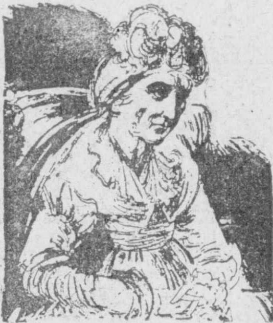
Η «Μητέρα τών Βασιλέων»