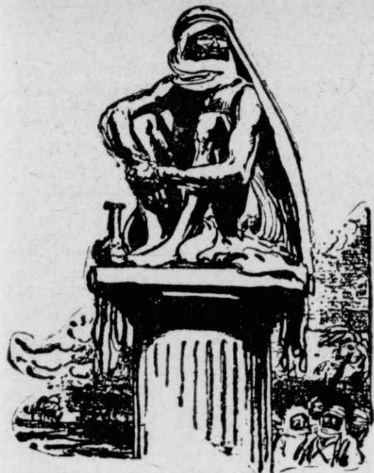
Ο «Άγιος Συμεών ο Στυλίτης...»

καί θέλοντας νά καταπολεμήσῃ τις άμαρτωλές όρμες τής σαρκας με σωματικό διαρκές μαρτύριο, όπως οί περισσότεροι άλλωστε τών άσκητών τών πρώτων χριστιανικών χρόνων, επέβαλε στον έαυτό του τó έξης φυβερό μαρτύριο: 'Ανέθηκε σ' έναν ψηλό μαρμαρίνο στύλο — λίγο πιό έξω άπ' τήν 'Αλεξάνδρεια — κι' έμεινε εκεί άπάνω σκαρφαλωμένος επί... έξηντα έννηά ολόκληρα χρόνια!