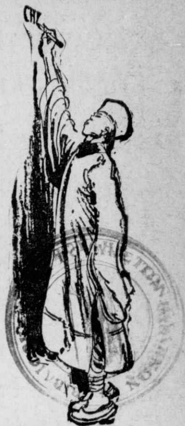
Η Αυτόυ... 'Υψηλότης ό Τσου-Τσιάγκ.

'Ο Ναπολέων επί τέλους μετά τó Βατερλώ, γκρεμίστηκε άπ' τόν ένδοξο θρόνο του. Τήν πτώσι του γίγαντος αυτού, έπακολούθησε ή πτώσις ολόκληρης τής οικογενείας του. Και τότε, πρό πάντων τότε, δείχθηκε ολόκληρο τó ψυχικό μεγαλείο τής σεπτής εκείνης βασιλομήτορος: Με όση ψυχραιμία κι' άπλοικότητα έβλεπε τά ήλιγγιώδη ύψη, στα όποια είχε άνεβή ή οικογένειά της, με άλλη τόση αξιοπρέπεια κι' έγκαρτέρησι ύπόμεινε — επί είκοσι ολόκληρα χρόνια, κατόπιν — τήν πτώσι της και τις άφθαστες στερήσεις της!